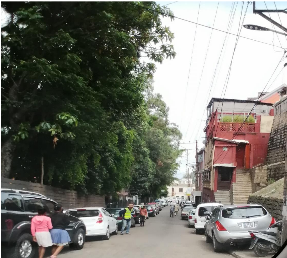
Rue étroite et trottoir encombré de voiture, obligeant les piétons à marcher au milieu de la route