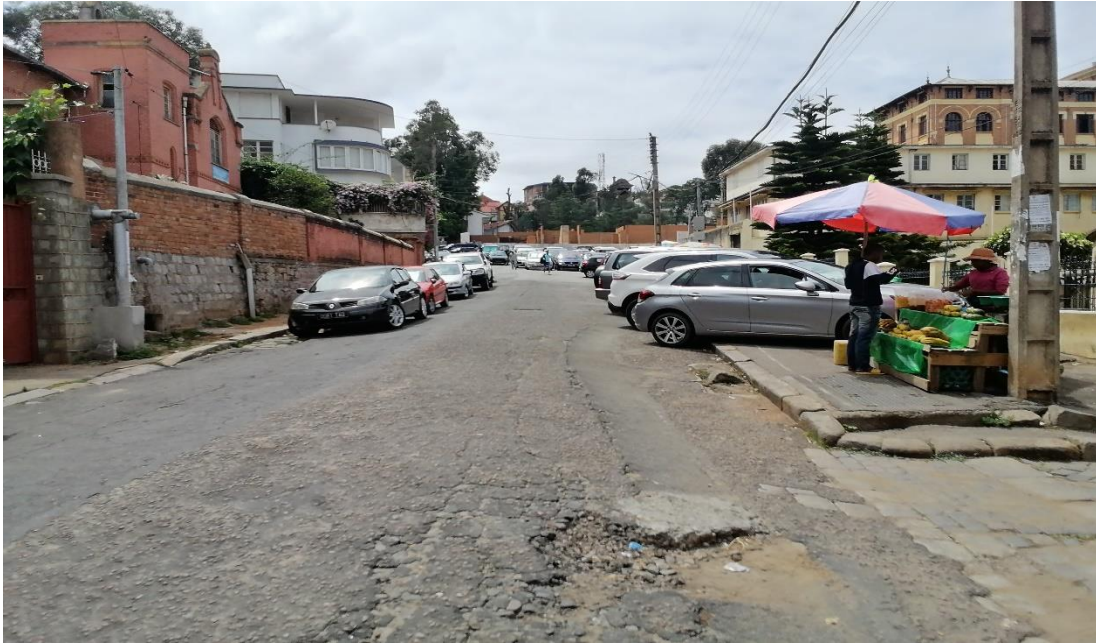
Stationnement des voitures sur les trottoirs et marchand de fruits sur le trottoir