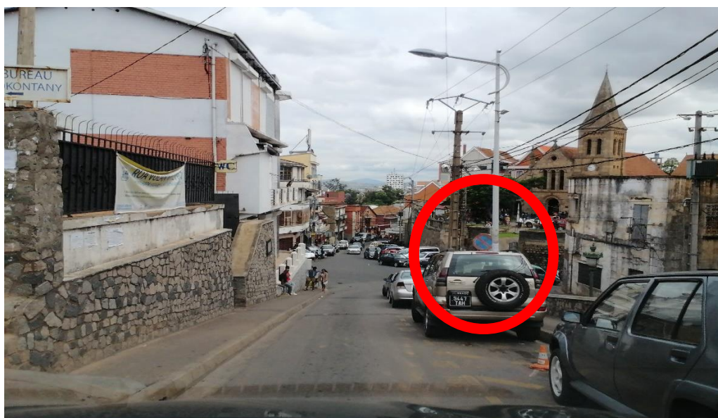
Non-respect du panneau « interdit de stationner »