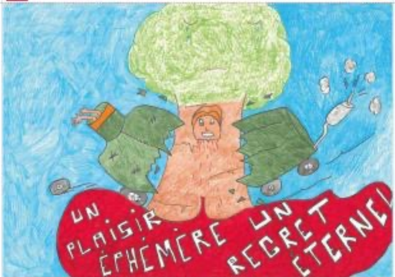
SKOLA APPRENTIS D'AUTEUIL (SAINTE BARBE)