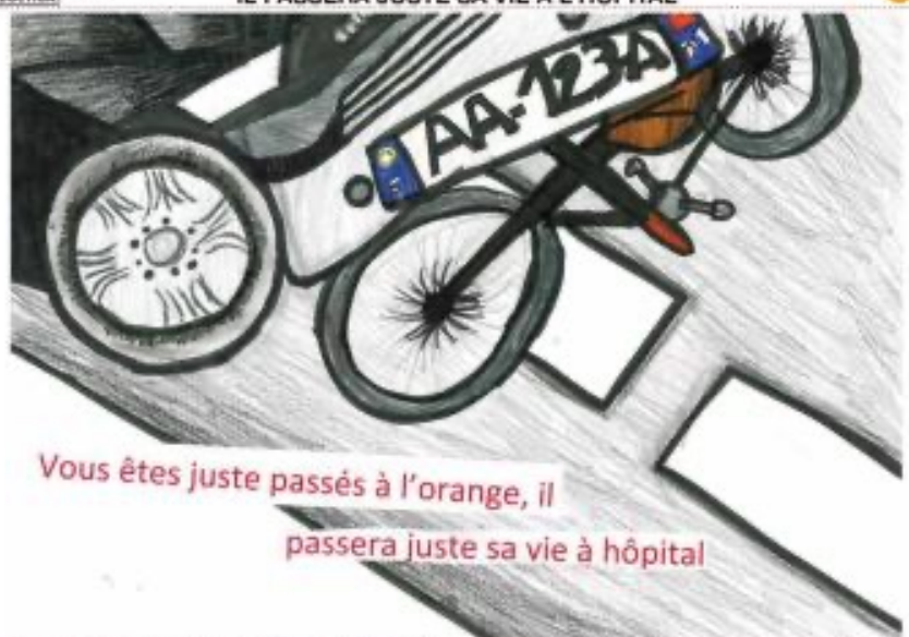
ÉCOLE DE PRODUCTION LE P'TIT PLAT (LE PETIT QUEVILLY)