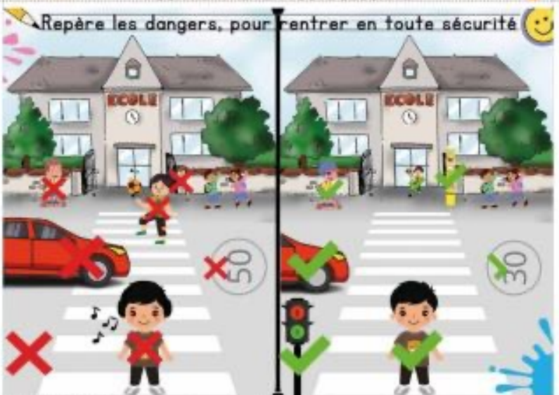
MFR LA CAPELLE