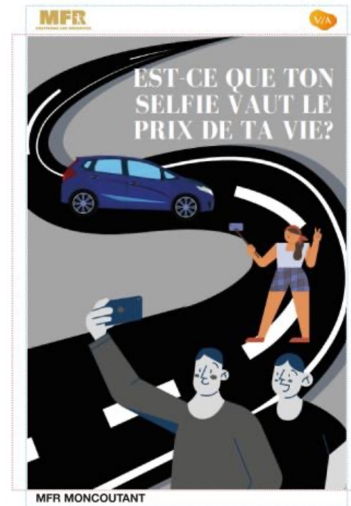
Affiche gagnante - VIA France 2023

Le visuel est un élément important de l’affiche. Dessin, photo, collage, bande dessinée, le choix du style déterminera la version finale de l’affiche.